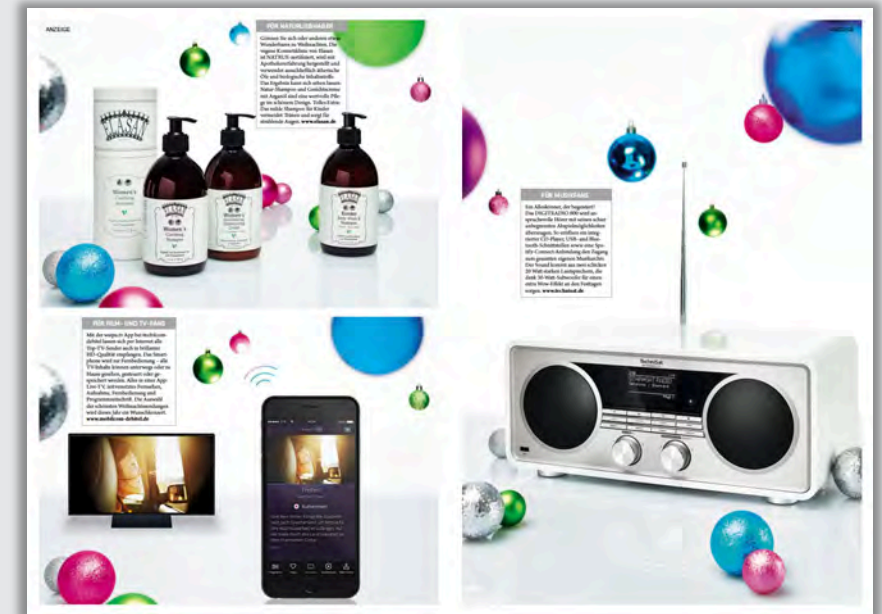
Basis: Promotionstrecke im F.A.Z. Magazin Dezember 2016