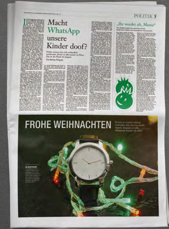
Anmutungsbeispiel F.A.S./freie Ressortwahl