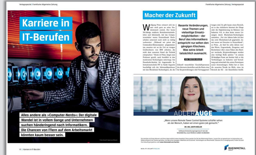
Sonderthema Beispiel „Karriere in IT-Berufen“ in der F.A.Z. Woche vom 10. Mai 2019

Nutzen Sie dieses spannende HR-Umfeld um die klügsten Köpfe und High Potentials aus dem IT-Bereich als Top-Arbeitgeber zu überzeugen.